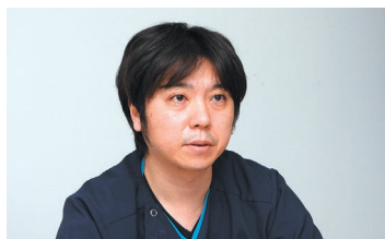
医療法人徳洲会 武蔵野徳洲会病院 栄養管理室 副室長

栄養管理室の8人の管理栄養士はがん病態栄養専門管理栄養士やNST専門療法士などの認定資格を持ち、それぞれが得意分野や専門性を活かした業務を行っている。栄養指導件数は2024年度には年間6,001件、月平均約500件にのぼり、入院支援