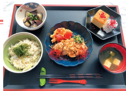
【行事食のおせち(左)と食欲を取り(鶏)戻すごちそう薬膳(右)】